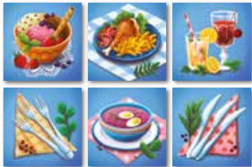
Počiatočné rozloženie kartičiek hráča

Kartičky rozdělíme do skupín podľa druhov – zvlášť nože , zvlášť vidličky atď. Takto rozdelené súčasti servisu otočíme čistou stranou hore a dôkladne ich v jednotlivých skupinách premiešame. Každý hráč dostane jednu kartičku z každého druhu a položí si ju pred seba bez toho, aby sa pozrel alebo ukázal ostatným, čo je na jej rube. Rozmiestnenie kartičiek musí byť vždy rovnaké, a to v poradí dezert, hlavný chod, nápoje a v druhom rade vidličky, polievka, nože .