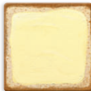
světlý chléb s máslem