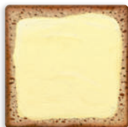
tmavý chléb s máslem